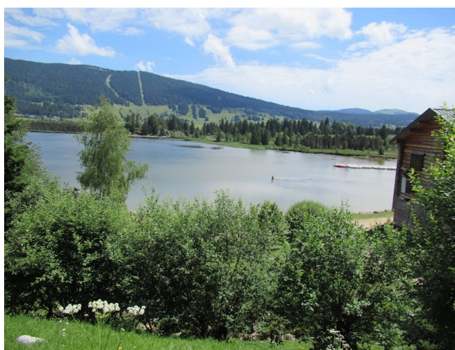
Le lac des Rousses