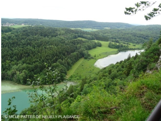
Belle vue sur les lacs depuis le pic de l'Aigle