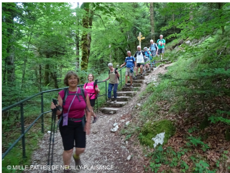
Des escaliers pour la descente