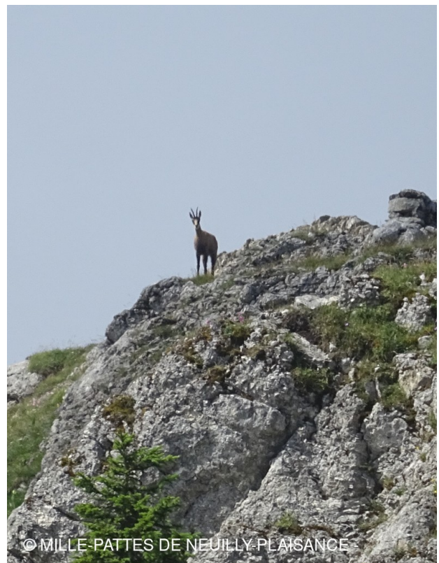
Un Chamois surveille