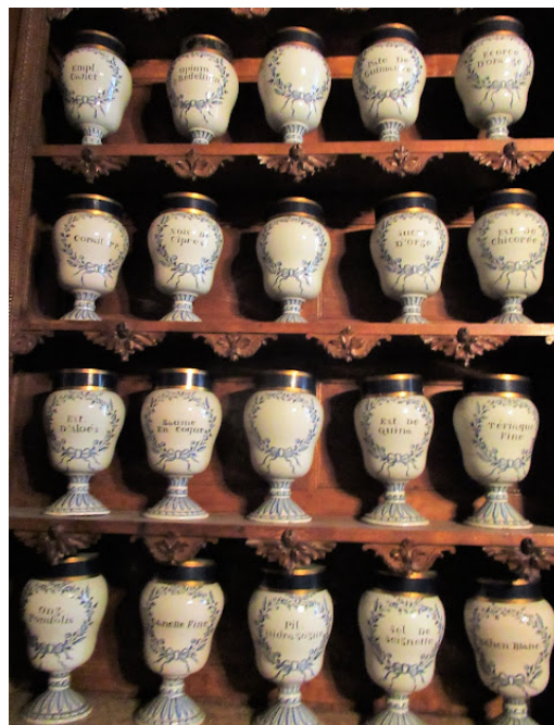
Faïenceris dans l'apothicairerie