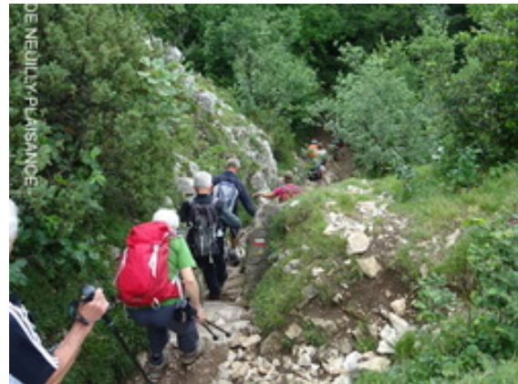
Après il faut redescendre...