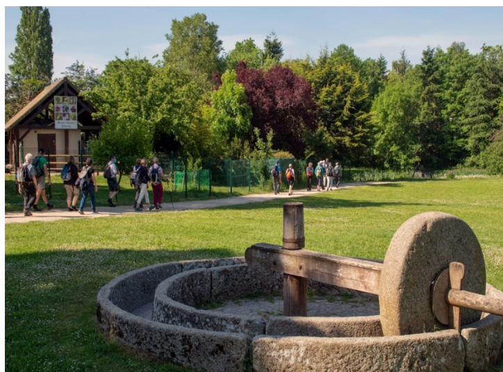
Domaine Louis Ratel à Bièvres