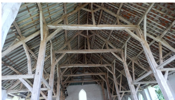
La grange aux dîmes