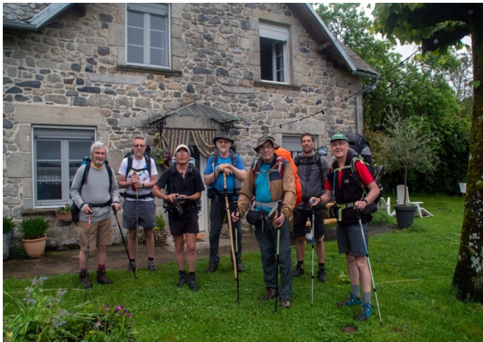
L'équipe prête pour le départ