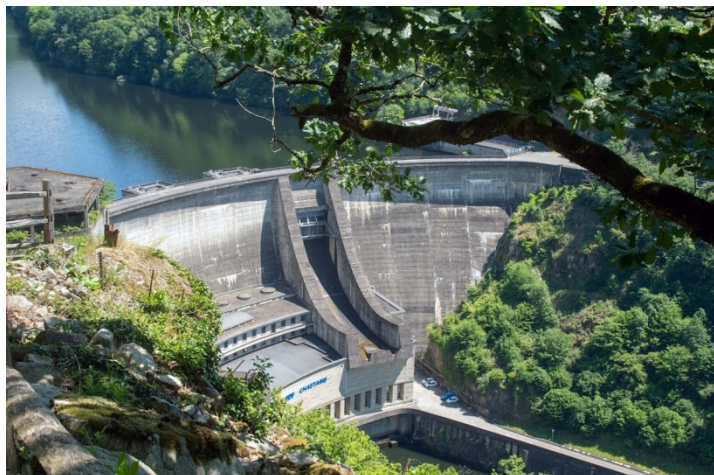
Le Barrage de Chastang