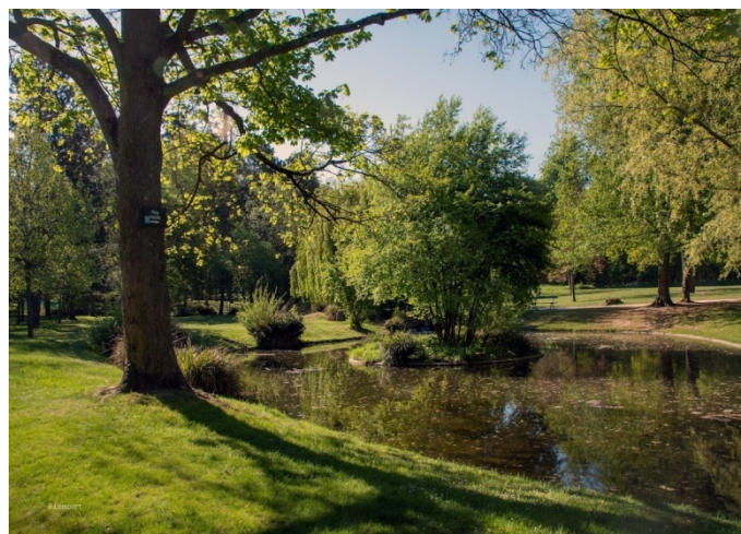
Mare au plateau de Gravelle

Dimanche 25 avril Jean-Jacques rassemblait 30 Mille-Pattes à la gare de Nogent pour une balade ensoleillée de 18,5 km tracée dans le bois de Vincennes. Le parcours nous monte au plateau de Gravelle pour descendre ensuite vers la Marne ; nous l'enjambons pour la longer sur la rive gauche jusqu'à son confluent avec la Seine avec 2 arrêts (patrimoine). D'abord sur les vestiges du château de Charentonneau à Maison-Alfort construit au 17 ème siècle ; il est détruit en 1950 à l'exception de 2 murs à arcades de l'orangerie que contemplent aujourd'hui les barres d'immeubles qui ont remplacé le château. Quelques scènes d'Archimède le clochard jouées par Jean Gabin ont été tournées sur les lieux. Jean-Jacques nous entraîne ensuite rue Nordling où en 1932 a été édifiée en béton armé l'église Sainte Agnès ornée de superbes vitraux et d'une remarquable table en fer forgé. Demi-tour au confluent pour retraverser la Marne et la longer côté Saint-Maurice. On aperçoit au loin, perché sur une tour, un cube penché prêt à tomber, œuvre de Jean Nouvel. Remontée vers le bois et pause dans une clairière jonchée de troncs où nous déposons notre séant pour déjeuner. Nous contournons le lac Daumesnil dont les berges sont tapissées de promeneurs avachis cuisant au soleil. La balade s'achève au château de Vincennes en passant par Saint-Mandé. Quelques Mille-Pattes rejoignent à pied Nogent pour récupérer leur véhicule.