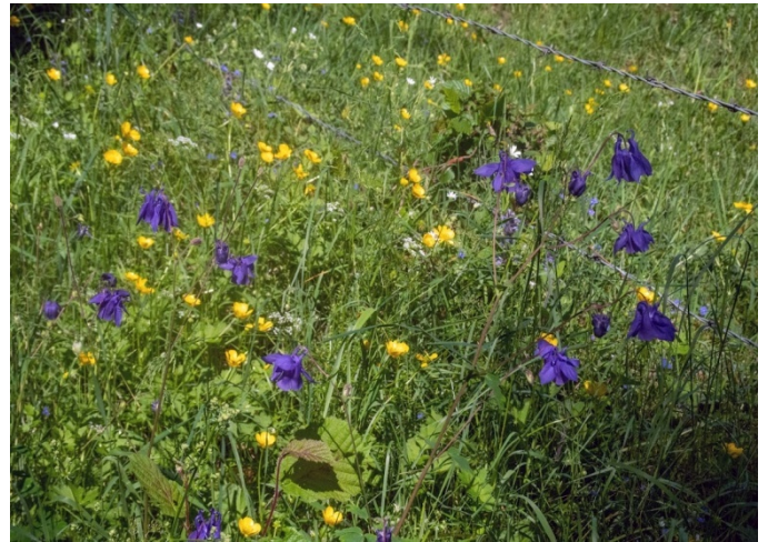
Beau bouquet de fleurs