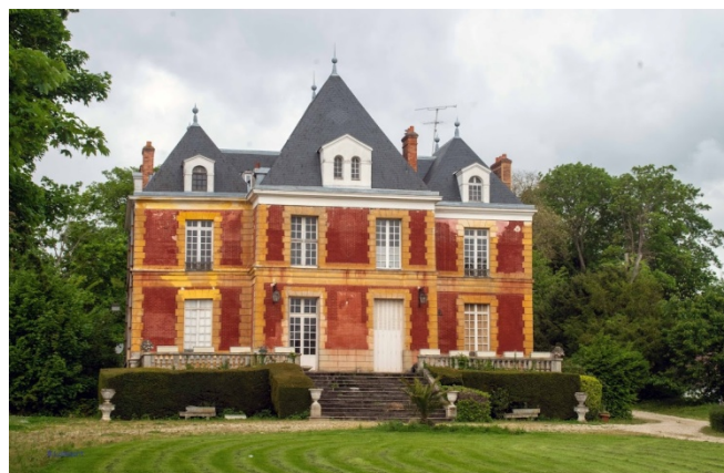
et le château rue de Douy à Annet