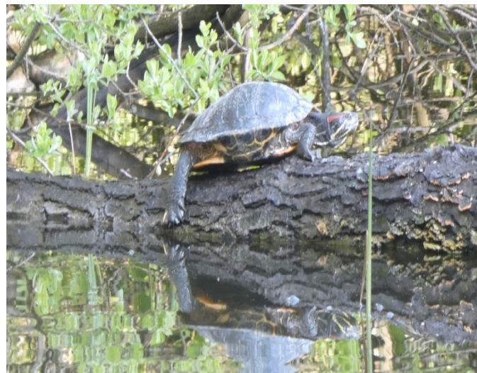
Cette tortue ne participait pas à la randonnée tonique !