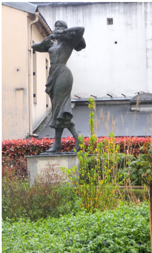
Reconnaissez-vous carla Bruni ?