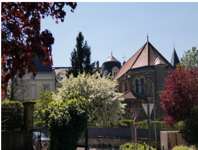
Du côté de Bry-Sur-Marne