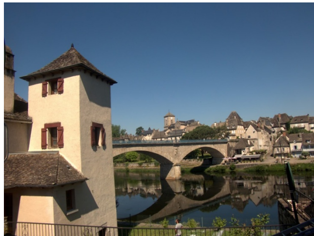
Argentat sur Dordogne