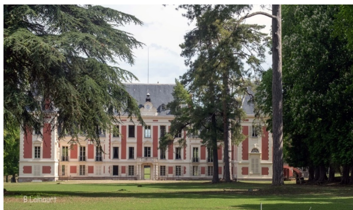
le château du Monceau à Liverdy