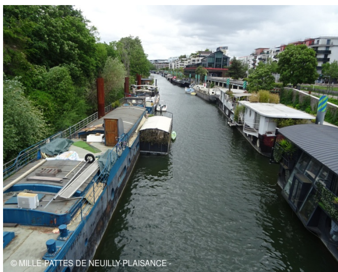
Péniches sur la Seine du côté d'Issy