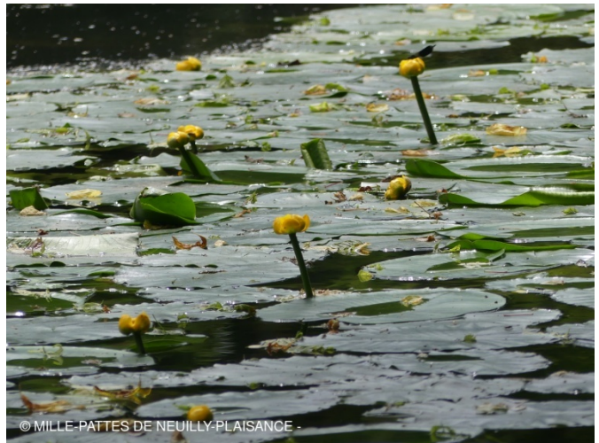
Nénuphars en fleurs dans la plaine de Sorgues

Après le pain, le premier besoin du peuple est l'éducation. Nous sommes 8 Mille-Pattes méditant ces paroles gravées sous la statue de Danton ; c'est le départ de la balade de Frédérique qui va nous mener de l'Odéon à la brasserie la Coupole ce jeudi 03 juin . La statue est située à l'emplacement de l'appartement de Danton balayé par la tornade Haussmannienne. Rue de Seine une plaque représentant une ruche ornée de la mention deo regique laborant (*) rappelle que les cires Trudon (fabrication de bougies) ont été fondées en 1643. Rue St Sulpice, Frédérique nous arrête au N°15 qui était une maison close fréquentée par des religieux. Alys, le nom de la tenancière y est toujours inscrit dans l'entrée (c'est Alys au pays des pères verts). Frédérique nous entraîne ensuite au jardin du Luxembourg pour un petit historique suivi d'une balade dans les jardins. En 1612, Marie de Médicis achète un hôtel particulier datant du 16 ème (aujourd'hui le petit Luxembourg) et les terrains qui l'entourent qu'elle fait aménager en jardin Florentin. Elle y fait construire le palais du Luxembourg (inspiré du palais Pitti) qu'elle devra quitter en 1631, car exilée après la journée des dupes. Le jardin du Luxembourg a plusieurs fois changé de mains jusqu'à la