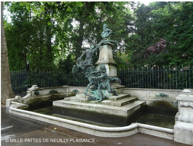
Belle fontaine au jardin du Luxembourg