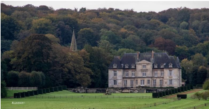
Château de Cuts