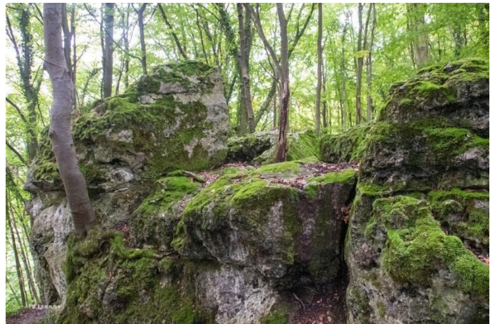
Des Pierres Sacrées