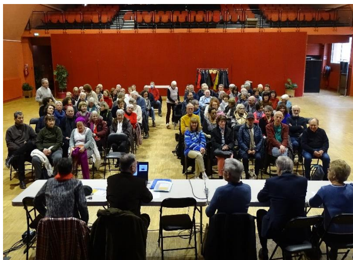
L'assemblée de mille-pattes

Les animateurs ont présenté les séjours et week-ends 2025 :