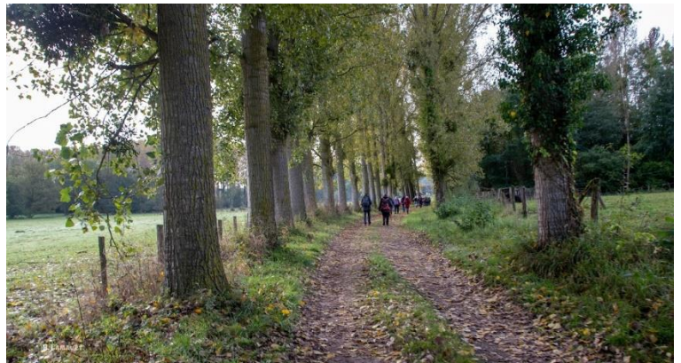
Belle allée boisée