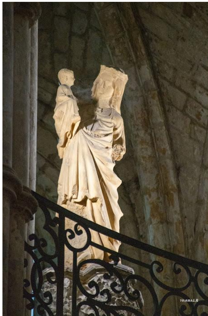
L'intérieur de la cathédrale