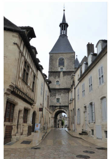
Tour de l'horloge. Place Saint Lazare