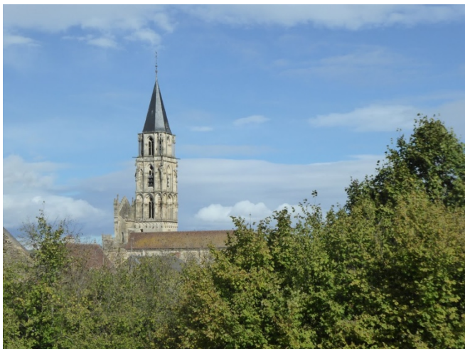
Eglise Notre Dame de Saint-Père

Déplacement en voiture au village voisin de Saint Père pour voir les ruines de l'église Saint-Pierre détruite par les huguenots et l'église Notre-Dame (beau narthex) restaurée par Viollet le Duc.