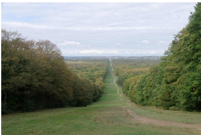
Tout au bout à 4 km : le château de Compiègne

chemins et pistes qui se croisent à des carrefours munis d'un poteau indicateur mentionnant les directions. Bruno nous fait remarquer la marque rouge qui orne les poteaux ; elle était destinée aux chasseurs pour leur indiquer le chemin à emprunter pour rejoindre le château sans s'égarer. Nous traverserons un seul hameau, celui du Vivier Frère-Robert. Pique nique dans une clairière (sans poteau indicateur). Le parcours mitonné par Jacques vient buter dans l'Aisne (la rivière) que nous longeons sur plusieurs km avant le retour au parking de la clairière de l'Armistice de 1918.