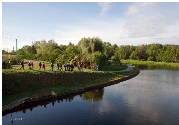
Le long du canal du Nivernais

Retour sur Paris sans problèmes avec une pluie intermittente.