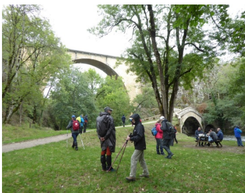
Les ponts de Pierre-Perthuis

Randonnée de 9 km au départ de Pierre-Perthuis dans la vallée de la Cure. Parcours essentiellement en forêt de feuillus qui ne semblent pas avoir souffert de sécheresse. Le sentier épouse les contorsions de la Cure sur les 5 premiers km, les plus curieux suivent Jean-Jacques qui propose un crochet montant pour voir la statue de Notre-Dame des lumières ; nous enjambons et abandonnons la Cure pour traverser le hameau de Cure qui conserve de beaux bâtiments, vestiges d'une abbaye bénédictine. A la sortie du hameau un cheval en mal d'amour nous lance des signes de détresse. Le sentier file ensuite entre le château de Domecy-sur-Cure (hideusement crépi) et son pigeonnier avant de s'enfoncer dans le bois de l'Epernay pour un retour au départ.