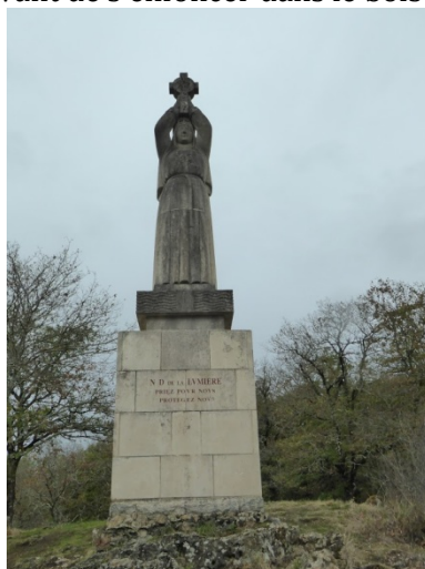
La statue de Notre-Dame des lumières