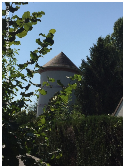
Joli donjon du côté de Fontenailles