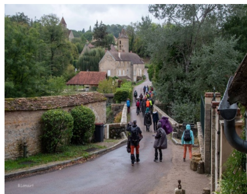
Descente sur la Cure