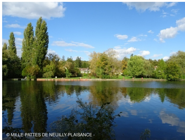
Sur les bords de l'Aisne