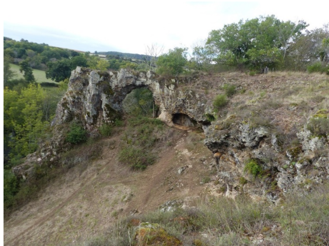
la Roche Percée

Pique nique du Campanile sur les hauteurs de la vallée de la Cure au site de la Roche Percée toujours ensoleillée.