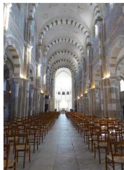
La basilique Sainte Marie-Madeleine de Vézelay