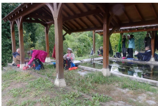
Pique nique au lavoir