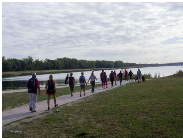
Arrivée tonique sur la base de Vaires-sur-Marne

Une Marche Tonique à Noisiel était programmée par Jean-Pierre le dimanche 6 septembre . Nous étions 18 dont trois à l'essai. Sur un joli parcours, nous avons pu randonner à environ 5,5 km/h.