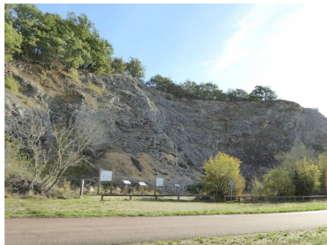
Carrière des 4 pieux dans la réserve naturelle du Bois du Parc