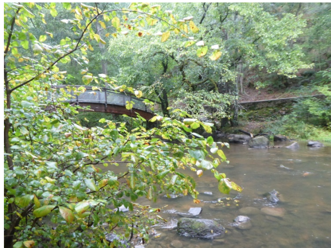
Le long du Cousin