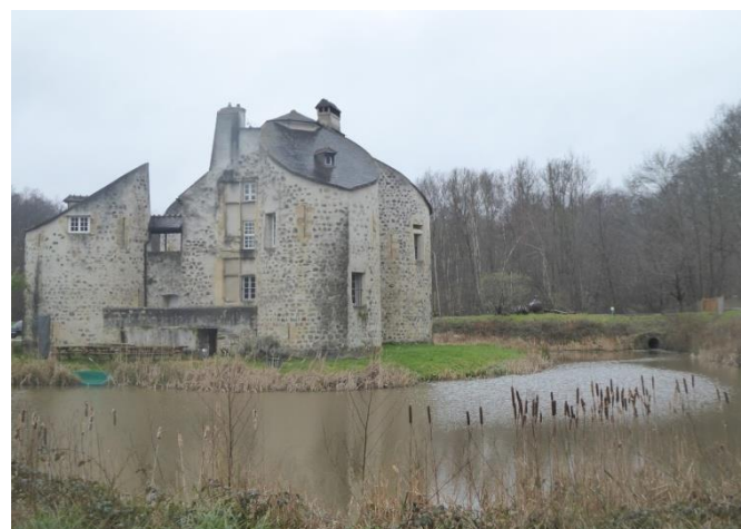
Château de la chasse en forêt de Montmorency

Dominique LG emmenait une dizaine de mille-pattes ce mardi 03 mars pour découvrir les espaces boisés entre Noisiel et Champs sur Marne sur un parcours de 9,9 km en traversant les bois de la Grange et de Grâce.