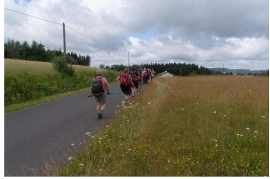
Belles couleurs sous un ciel menaçant

SAMEDI 04 juillet : La matinée est consacrée à la visite de la magnifique abbaye de la Chaise-Dieu (casa dei). Elle a été construite en un temps record entre 1344 et 1352 suite à l'élection du pape limousin Clément VI ; elle sera dotée au 16 ème siècle d'une éblouissante collection de tapisseries flamandes. Une belle fontaine, datée de 1602, orne son parvis. Sa façade coiffée de 2 clochers offre un aspect sévère, mais elle recèle des choses inattendues : le tombeau de Clément VI (les autres papes sont enterrés à Rome), une fresque de 3 panneaux représentant une danse macabre où quel que soit son rang, (noble, bourgeois, religieux ou artisan) chaque personne mise en scène est portraiturée à 2 étapes de son existence, vivante et morte. La morte invitant la (encore) vivante à danser. Fresque à montrer aux gens trop optimistes... Il faut mentionner l'étonnante salle des échos, l'orgue, les 144 stalles en chêne ceinturant le chœur, le jubé, le cloître qui ne conserve que 2 galeries. Un festival de musique sacrée initié par le pianiste Georges Cziffra a permis de financer une restauration de l'abbaye.