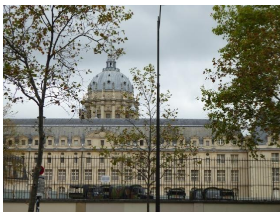
Val de Grâce : Hôpital des armées