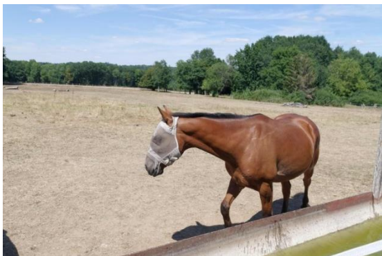
Ce n'est pas comme ça qu'il faut porter le masque !