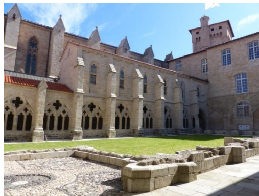
La chaise Dieu