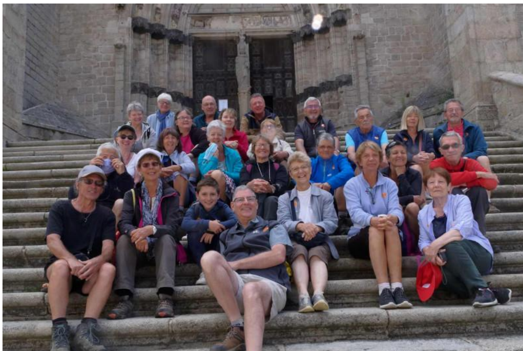
La bonne humeur est de mise pour tout le groupe malgré les conditions dues à la COVID

Nous partageons les locaux avec la Pédale Douce (un groupe de cyclistes).