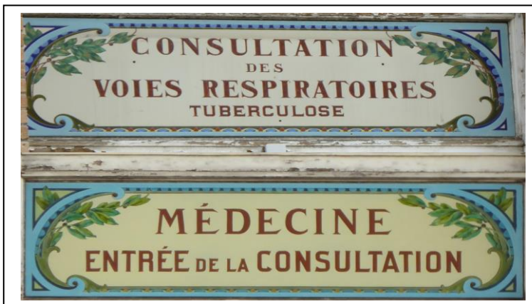
Anciennes signalisations des services à l'hôpital Cochin

Onze mille-pattes à la petite randonnée de reprise à Emerainville ce lundi 24 août , organisée par Jean-Pierre .