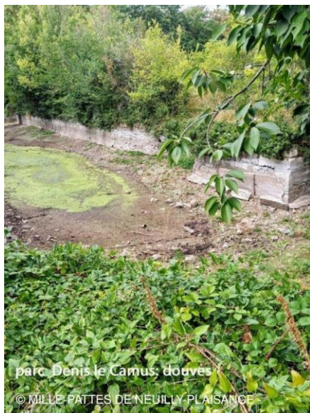
parc Denis le Camus : douves Parc Denis Le Camus : douves