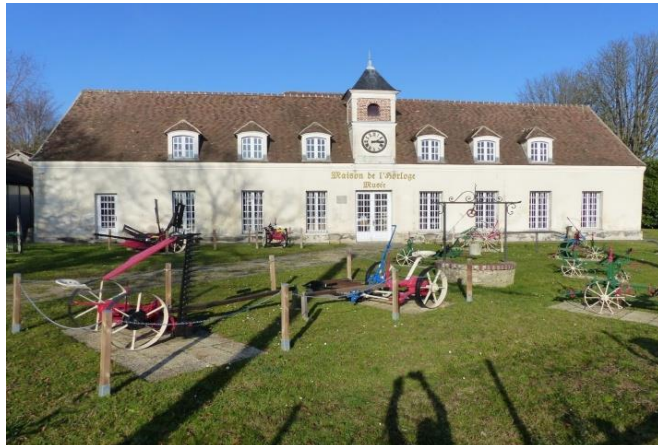
Musée du travail de Montfermeil