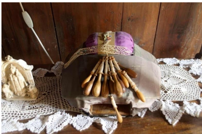
Musée de la dentelle d'Arlanc

Dîner : merlu ou boulette de viande, ratatouille, éclair au chocolat ou millefeuilles.