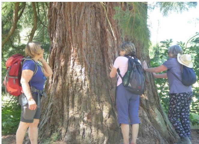
Ce séquoia invite à la communion avec la nature