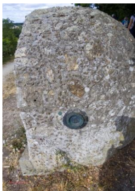
Repère de nivellement sur la Dhuis