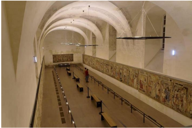
La nef des tapisseries