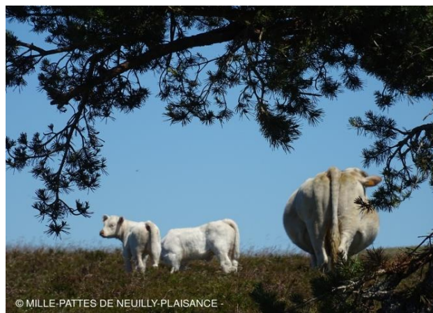
Bovins à l'ombre

MERCREDI 1 er JUILLET : Au programme, vieilles dentelles et randonnée de 19,4 km sur un dénivelé de 544 m.