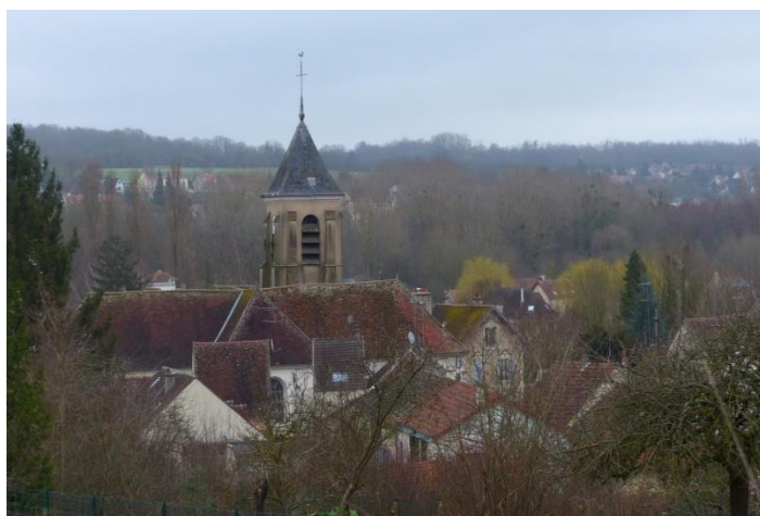
Vue sur les toits

Très belle randonnée champêtre, organisée par Dominique LG ce dimanche 23 février au départ de Villiers sur Morin. Sous un ciel gris qui toutefois s'abstient de déverser ses eaux sur nos têtes, par des chemins raisonnablement boueux, parfois obstrués d'obstacles, tantôt à travers bois, tantôt à travers champs, le parcours de Dominique permet à 33 mille-pattes d'apprécier sur 18 km les paysages ondulés des environs de Villiers, Coutevroult, Voulangis et Crécy la Chapelle.