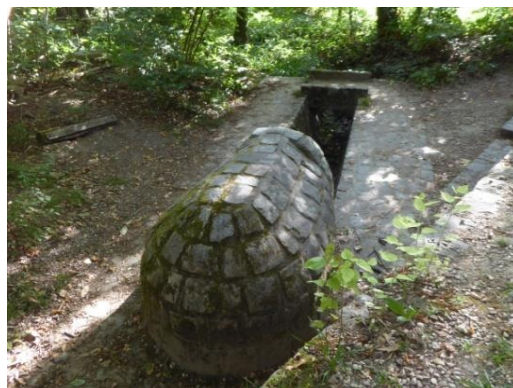
Fontaine du frère Jean en forêt de Bondy