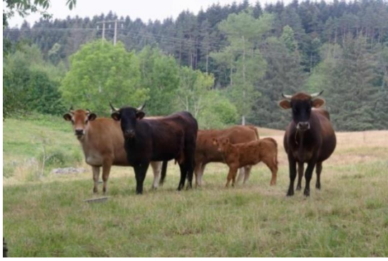
Prêts pour le concours des plus belles cornes