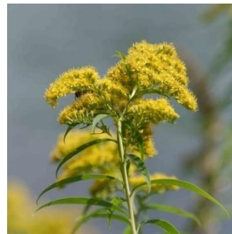
Solidago Verge d'Or