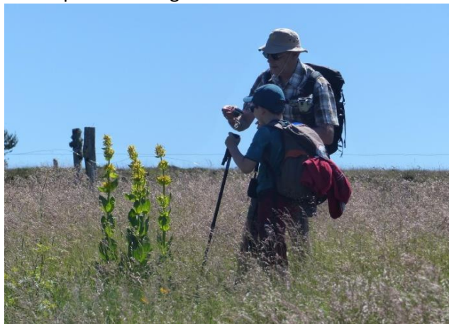
Apprentissage de la boussole