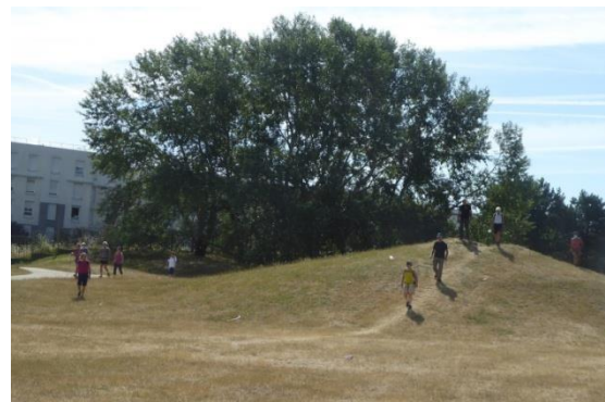
Les vallons de Georges Valbon