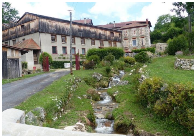
Moulin de Vimal

JEUDI 02 juillet : La matinée est consacrée à la visite d'Ambert précédée par celle du marché dont les nombreux étals s'éparpillent dans les rues avoisinant la mairie. La Dore coule à Ambert.