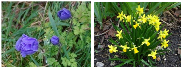
Les belles fleurs de Montreuil

Vendredi 07 février Dominique M emmenait 22 personnes pour découvrir les paysages fontenaysiens en passant par l'Eco parc des Carrières aménagé sur le site des anciennes carrières de gypse.