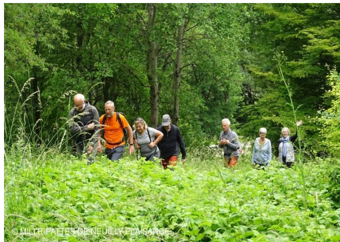
La randonnée tonique n'empêche pas la bonne humeur