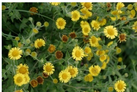
Pulicaire ou Inule