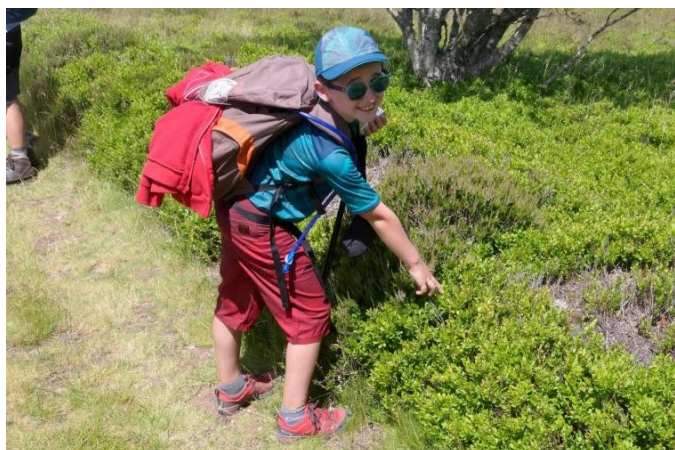
Gourmandises en chemin

Diner : quenelles ou filet de dinde, ratatouille, purée.