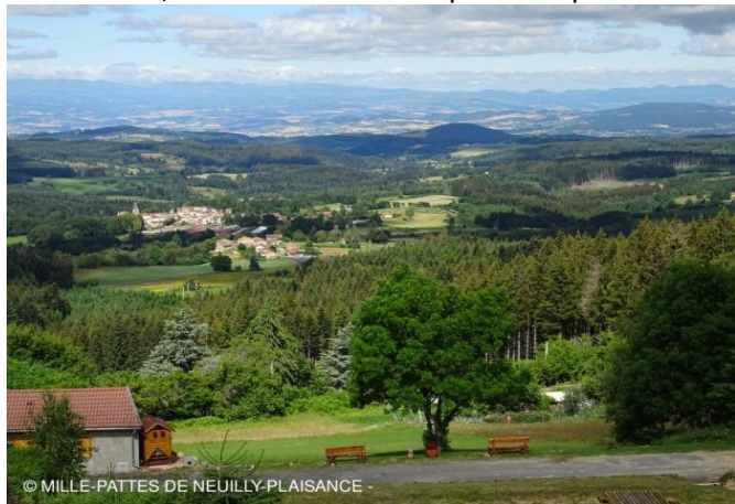
Paysages du Livradois-Forez

Tous les soirs, animation avant et après le repas avec des jeux classiques des villages vacances.