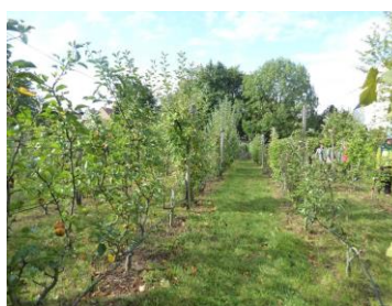
Vergers de l'îlot à Fontenay-sous-Bois