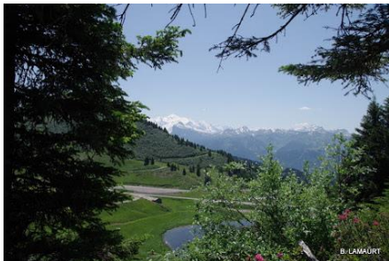
Vues sur le lac de Joux Plane depuis le chemin de crête

Départ à 8 h pour le parking des Chavannes situé à proximité des Gets, à 1450 m. La randonnée s'étire sur 12 km et s'étagera entre 1324 m et 1825 m. Ça commence par une descente boisée jusqu'au Grand Pré (1324 m) pour remonter sur un terrain dégagé jusqu'aux Raverettes (1426 m). Le sentier s'élève ensuite vers le sud d'abord jusqu'au lac à truites de Nyon Guérin (1620 m). Déjeuner au col de Joux Plane (1715 m) face au Mont Blanc. Nous prenons ensuite un sentier qui monte rudement jusqu'au Randolly (1825 m), puis le sentier parfois escarpé descend (moins violemment qu'hier) jusqu'au Coutaz (1656 m) où nous récupérons notre itinéraire et suivons la route que nous quittons au Plan du rocher (1602 m). Arrivée aux Chavannes vers 15 h 50 et retour au Choucas. Orage violent dans la nuit