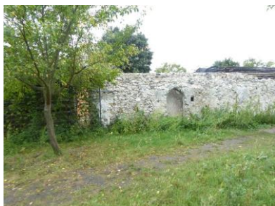
Murs à pêches à Montreuil

Ce dimanche 29 septembre , le comité départemental de la Randonnée de la Seine-Saint-Denis organisait avec le Comité de Tourisme et Est Ensemble la Grande Randonnée du Parc des Hauteurs. Seulement une petite dizaine de Mille-Pattes sur les 500 randonneurs présents. Rebutés sans doute par la météo annoncée, mais à part une bonne averse le matin, le restant de la journée a été correct. Départ square de la Roquette pour terminer à l'écoparc des carrières de Fontenay-sous-Bois en passant par le père Lachaise, le parc des Beaumonts et le Verger de l'Îlot (Fontenay).