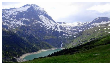
Barrage de Plan d'Amont et Plan d'Aval