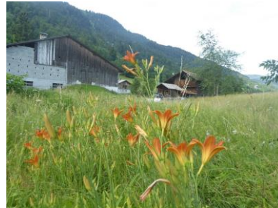
Le Lys dans la vallée