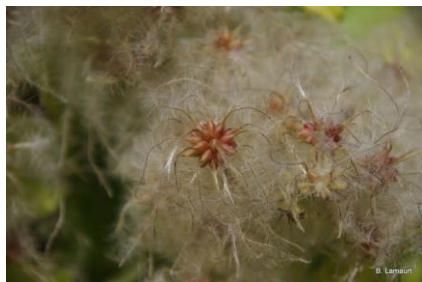
Clématites près de la Marne