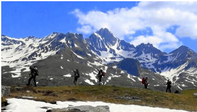
Neige et ciel bleu