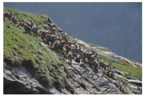
Troupeau de bouquetins