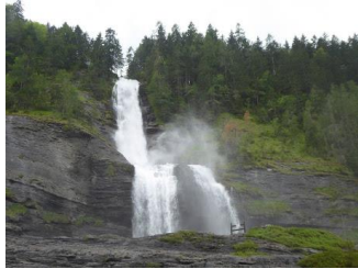
Cascade du Rouget

L'après-midi : randonnée de 12 km au départ de Salvagny (857 m) pour un parcours boisé d'abord près du Giffre des fonts puis du Giffre des Sales (il y a donc au moins 3 Giffre) en passant par la belle cascade du Rouget (hauteur de 100 m) puis au Lignon point culminant à 1159 m et retour par les Fardelay avec un sentier enlacé avec la D429.