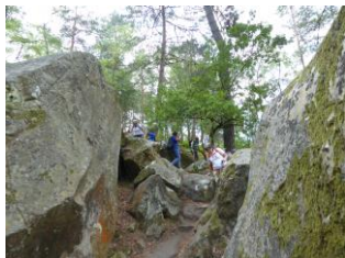
Les « blocs » de Fontainebleau