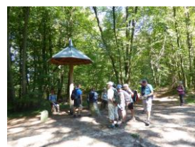
Pause au soleil d'août