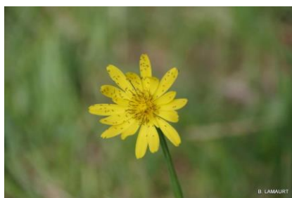
Belle fleur jaune