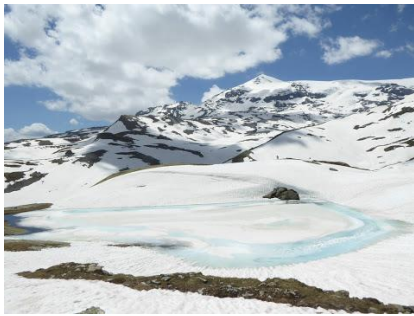
La neige est bien présente