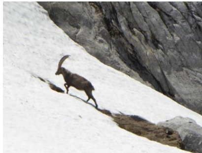
Bouquetin sur la neige