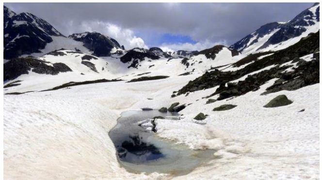
Neige et ciel gris