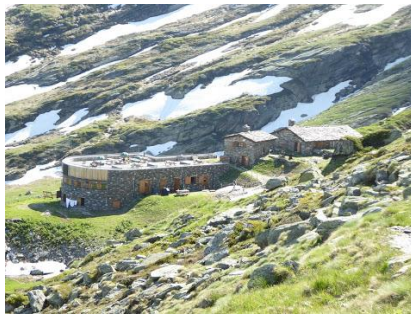
Refuge de l'Arpont