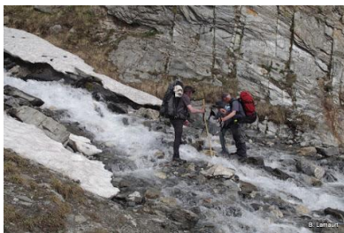
Traversée de gué