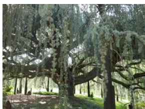
Dans le parc de la vallée aux loups