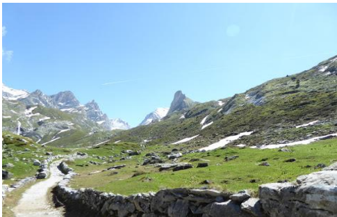
Neige sur les hauteurs

Il est 17 h quand nous arrivons au refuge de la Vanoise.