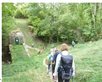
Siphon de la Dhuis

Dominique LG emmenait 12 mille-pattes le jeudi 12 septembre pour un parcours de 16 km en forêt autour de Villeneuve le Comte