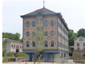
Ancienne usine Menier

Mardi 16 juillet , randonnée autour du patrimoine de Noisiel créé par les chocolatiers Menier. Parcours de 8 km choisi par Frédérique au départ de la gare RER de Noisiel, 17 participants. Nous traversons le parc de Noisiel puis longeons le magnifique bâtiment de production en briques et ossature fer construit vers 1905 sur la Marne par Henri et Gaston Menier fils d'Emile. Patrons sociaux, ils ont fait construire pour leurs ouvriers, des maisons, un réfectoire, 2 cafés situés face à face (on fréquentait l'un ou l'autre selon ses convictions politiques) une maison de retraite, la mairie. L'itinéraire de Frédérique nous permet d'admirer ces belles constructions dominées par la brique, témoin de l'empire industriel créé par la famille Menier, maires de Noisiel de 1871 à 1959. La chocolaterie vient d'être vendue par Nestlé.