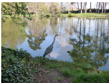
Héron à Vincennes