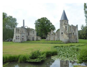
Château royal du Vivier