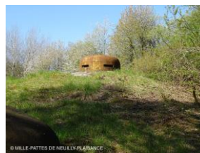
Un des blocs