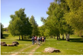
Vallée de l'Ysieux

Douze randonneurs accompagnaient Dominique M le mercredi 15 mai pour une randonnée de 11,5km dans la vallée de l'Ysieux au départ de Vieux Fosse dans le val d'Oise.