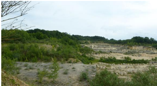
Panorama des Glachoirs : la carrière

Petite affluence (19 participants seulement) en ce jour de la Pentecôte ( dimanche 9 juin ). Les absents ont eu tort! Pierrette avait préparé un bel itinéraire à Crécy Saint Vaast lès Mello. Temps gris, pas trop froid et des chemins bien praticables, en faisant attention à bien choisir son itinéraire !