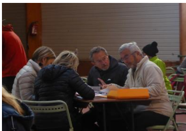
Concentration et préparation du RC : Etude des cartes et des documents