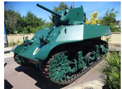
Un char à Merville