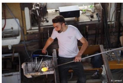
Travail du verre