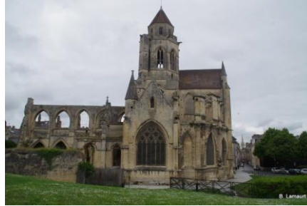
Eglise Saint Etienne le Vieux