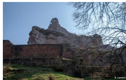
Château de Fleckenstein

Lundi 15 avril : Randonnée de 14 km (dénivelé 545 m) au départ d'un parking sis près de Lembach sur la route de Schonau (village situé en Allemagne). Après avoir dépassé un hameau et une ferme le chemin s'enfonce en forêt (toujours des charmes, hêtres, épicéas et pins, peu de sapins) pour atteindre le château de Frensborg , construction du 13 ème en partie troglodyte appuyée sur un rocher de grès rose à une altitude de 305 m. Il est détruit au 14 ème car repaire de chevaliers brigands, reconstruit au 15 ème , puis détruit au 17 ème par les Français. Nous descendons et enjambons d'abord la rivière Sauer puis la frontière, traversons ensuite le village de Hirchthal et regagnons la France pour arriver à la maison forestière de Fleckenstein où nous déjeunons attablés. En attendant la visite de Fleckenstein , un groupe de 25 intrépides mille-pattes profite de ce temps disponible pour une boucle qui commence par une montée de 200 m ; cette boucle va nous mener à deux autres châteaux, d'abord celui de Hoebourg ensuite celui de Lowenstein dont les ruines sont accessibles par des escaliers et échelles. Visite guidée du château de Fleckenstein . La guide nous décrit les 3 principales époques architecturales qui ont vu les transformations du château dont la première version date du 12 ème avant sa destruction au 17 ème siècle.