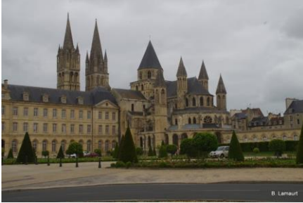
L'Abbaye aux Hommes