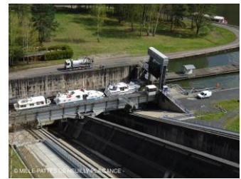
Plan incliné : ascenseur à bateaux

Mercredi 17 avril : Ciel couvert qui se dégagera rapidement. Randonnée des écluses au départ de Henridorf (11 km dénivelé 270 m). Nous cheminons sur le chemin de halage du canal de la Marne au Rhin entre Vitry le François et Strasbourg. Sur un tronçon de 4,5 km aujourd'hui abandonné et en partie à sec, 17 écluses y étaient réparties. Ces écluses ont été remplacées par un ascenseur à bateaux que nous visitons. Visite du plan incliné (c'est le nom officiel de l'ascenseur à bateaux de ST Louis-Arzviller). Le plan incliné sert à monter ou descendre les bateaux, en moins de 20 minutes, entre 2 biefs sur un dénivelé de 44 m, et ce gratuitement. Nous terminons par une petite croisière sur le canal aval en empruntant l'ascenseur à la descente et en montée au retour (toutes deux impressionnantes). Retour aux voitures par une piste forestière un peu boueuse dont les arbres commencent à s'épanouir. Arrêt à la cristallerie Lehrer pour quelques achats et rentrée au VVF.