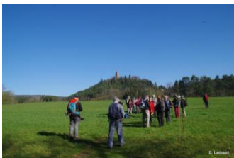
En direction du château de Waldeck

Jeudi 18 avril : La randonnée de 16,5 km (dénivelé 355 m) au départ de l'étang de Hanau va nous emmener de ruines en étangs sous un beau soleil qui transperce les forêts, d'abord au château de Waldeck construit au 13 ème sur une barre rocheuse. Nous déjeunons autour de la chapelle Notre Dame des Bois. Nous visitons ensuite les ruines des châteaux de Rotrembourg puis celles de Falkenstein. Retour à l'étang de Hanau en passant par celui de Lieschbach.