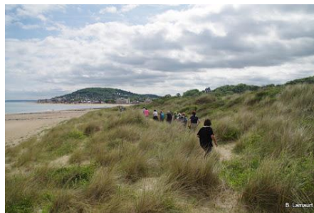
Dans les dunes