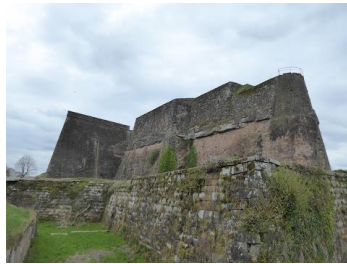
La citadelle de Bitche