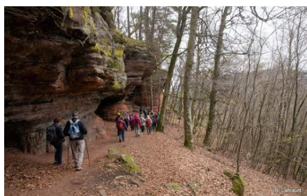
Falaises de grès rouge de l'Altschlos