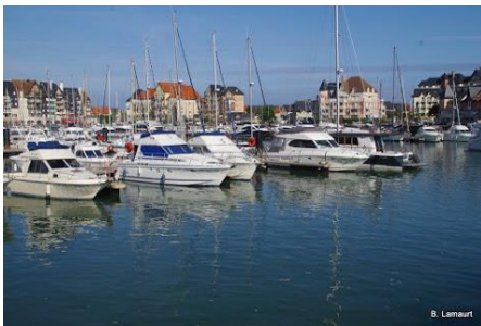
Port de plaisance de Dives

Vendredi 31 mai : réveil avec le soleil... encore un peu frais le matin, mais ça ne va pas durer ! Départ vers 8h45 en direction de Dives qui sera notre point de départ pour aller visiter Cabourg. Une belle zone pavillonnaire nous sert d'approche (certains envient les pelouses normandes !) et nous arrivons dans la rue principale (le boulevard de la mer) déjà bien animée : les vitrines retardent certains marcheurs ! Nous contournons le Grand Hôtel pour arriver sur le bord de mer. Les sanitaires sont particulièrement recherchés et nous découvrons que nous sommes sur le méridien de l'Amour. Nous prolongeons le bord de mer jusqu'à une zone dunaire, puis rejoignons nos voitures. Direction la Redoute de Merville avec ses blockhaus où nous pique-niquons avant de démarrer la randonnée qui va nous entraîner d'abord autour de la réserve ornithologique de Gros Banc (avec la chaleur, les oiseaux dorment !) puis parmi le bocage normand à Gonnevillle où nous ferons une pause dans le parc de la mairie. Nous passons ensuite à la batterie de Merville, en plein préparatifs pour les cérémonies des 75 ans du débarquement. Enfin, nous rejoignons Merville-Franceville et enfin nos voitures. Au total, dans la journée, nous avons fait une vingtaine de kilomètres !