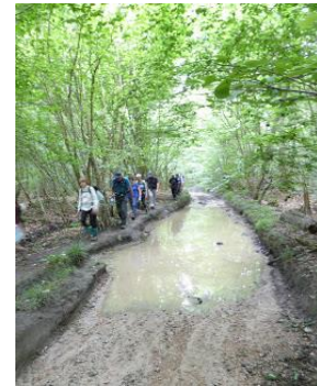
Que d'eau !

Samedi 15 juin : Jeanne emmenait 13 personnes autour de la Montagne Sainte Geneviève pour 6 km.