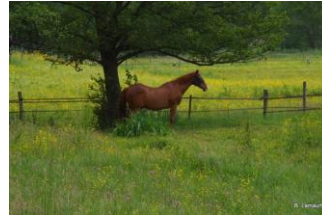
Vallée de Chevreuse