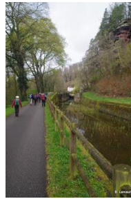
Lelong du canal