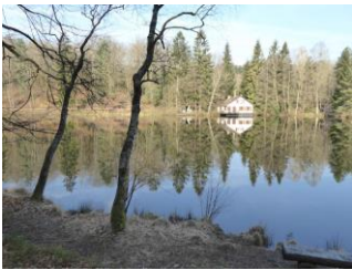
Le long de l'étang de Hasselfurth

Elle s'étale sur 300 m de long, 45 de large et est protégée par des remparts impressionnants. Du haut de la citadelle très beau panorama sur la ville et ses alentours, en contre bas on aperçoit les jardins de la paix, belles créations récentes par des artistes jardiniers. La visite est centrée sur la guerre franco-prussienne de 1870 et le siège de la citadelle ; elle s'effectue selon un parcours audiovisuel original et efficace : chaque visiteur est muni d'un casque qui dans chaque espace visité commente automatiquement le lieu où le film est projeté. Nous terminons en visitant la chapelle, seul vestige de l'époque Vauban. Au 18 ème , une citerne a été construite sous la chapelle pour récupérer les eaux de pluie. Nous descendons ensuite vers le VVF sous un ciel couvert qui crachote un peu.