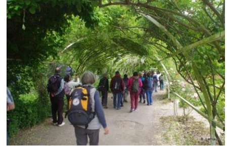
Dans un parc

Vendredi 31 mai : réveil avec le soleil... encore un peu frais le matin, mais ça ne va pas durer ! Départ vers 8h45 en direction de Dives qui sera notre point de départ pour aller visiter Cabourg. Une belle zone pavillonnaire nous sert d'approche (certains envient les pelouses normandes !) et nous arrivons dans la rue principale (le boulevard de la mer) déjà bien animée : les vitrines retardent certains marcheurs ! Nous contournons le Grand Hôtel pour arriver sur le bord de mer. Les sanitaires sont particulièrement recherchés et nous découvrons que nous sommes sur le méridien de l'Amour. Nous prolongeons le bord de mer jusqu'à une zone dunaire, puis rejoignons nos voitures. Direction la Redoute de Merville avec ses blockhaus où nous pique-niquons avant de démarrer la randonnée qui va nous entraîner d'abord autour de la réserve ornithologique de Gros Banc (avec la chaleur, les oiseaux dorment !) puis parmi le bocage normand à Gonnevillle où nous ferons une pause dans le parc de la mairie. Nous passons ensuite à la batterie de Merville, en plein préparatifs pour les cérémonies des 75 ans du débarquement. Enfin, nous rejoignons Merville-Franceville et enfin nos voitures. Au total, dans la journée, nous avons fait une vingtaine de kilomètres !