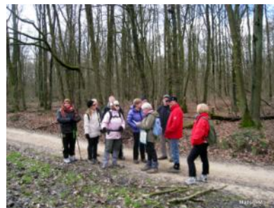
15 février: forêt de Bondy. 16 personnes