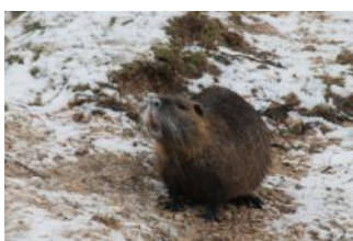
26 février: Draveil-Vigneux. 11 personnes