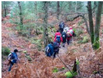
4 février: Plailly. 23 personnes