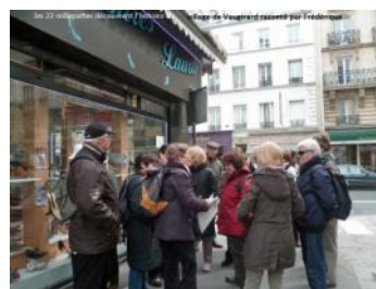
21 mars: Vaugirard. 21 personnes