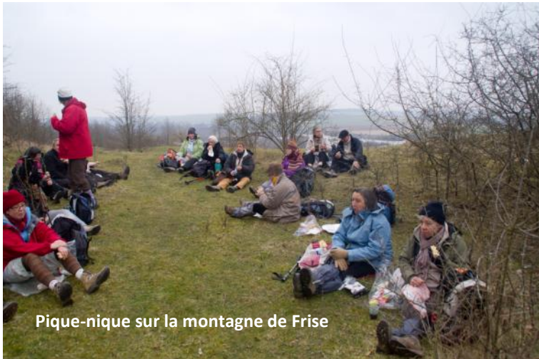
Pique-nique sur la montagne de Frise