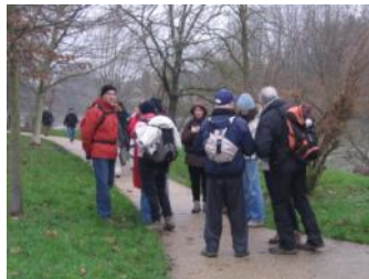
13 janvier: les bords de Marne. 23 personnes.