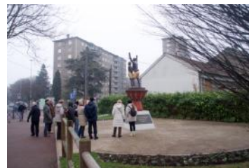
24 janvier: Drancy, un village. 13 personnes