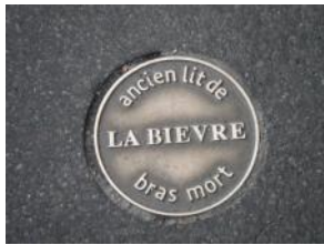
8 janvier : La Bièvre à Paris 22 personnes