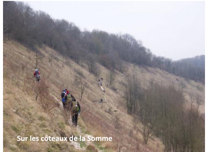
Sur les côteaux de la Somme