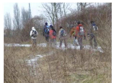
24 février: le chemin des 8 communes. 11 personnes.