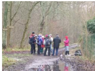
10 février: Ozoir la Ferrière. 11 personnes.