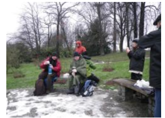
27 janvier: la Basse vallée de la Bièvre. 13 personnes.