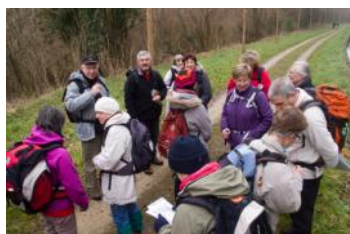
10 mars: Crouy sur Ourcq. 40 personnes!