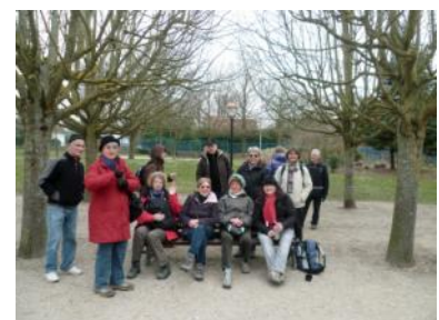
28 mars: entre Marne et canal. 20 personnes.