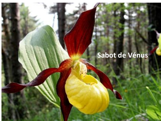
Sabot de Vénus